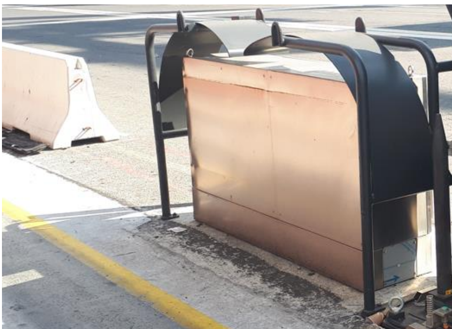
Slika 6: Vodilo kabla

Vodilo kabla je potrebno namestiti v liniji odlaganja napajalnega kabla E-RTG dvigala.