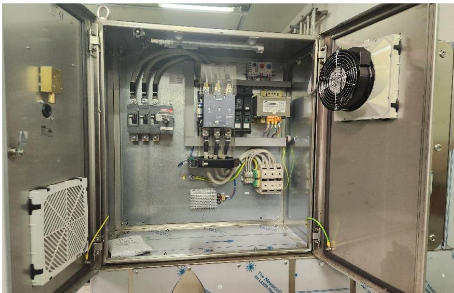
Slika 3: Notranji izgled močnostnega dela (leva stran)

Notranji izgled močnostnega dela (leva stran):