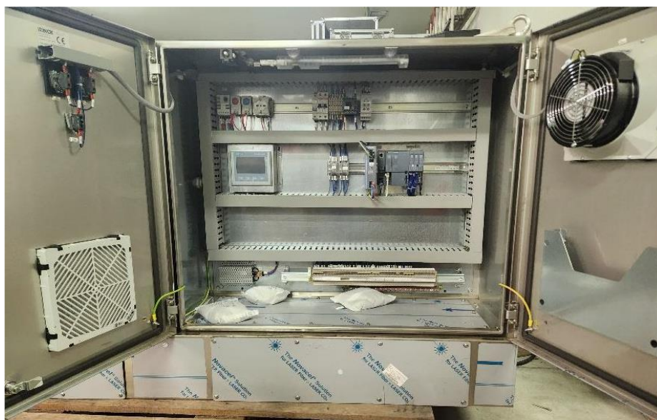
Slika 4: Notranji del krmilnega dela (desna stran)

Notranji del krmilnega dela (desna stran):