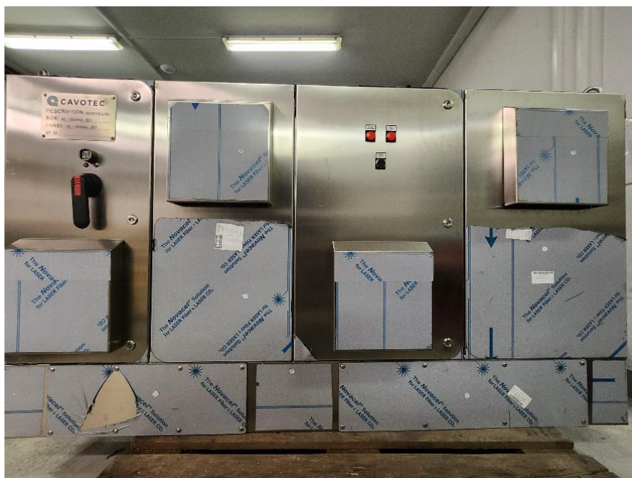
Slika 2: Zunanji izgled omarice